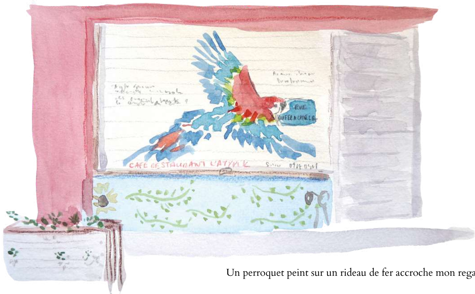
Un perroquet peint sur un rideau de fer accroche mon regard.